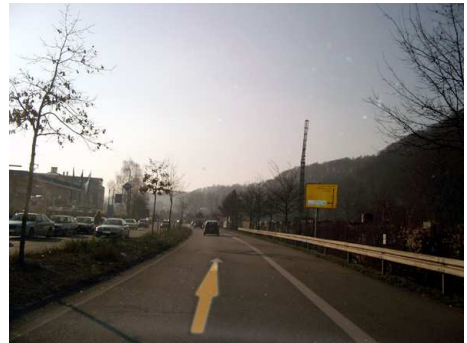
4. und dann seid ihr auf der Schnellstraße