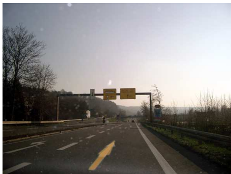
5. An diesen beiden Abzweigungen vorbei fahren, immer geradeaus weiter