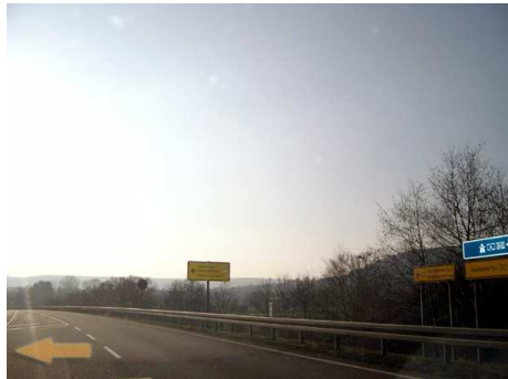
6. Links gehts nach Kleinblittersdorf