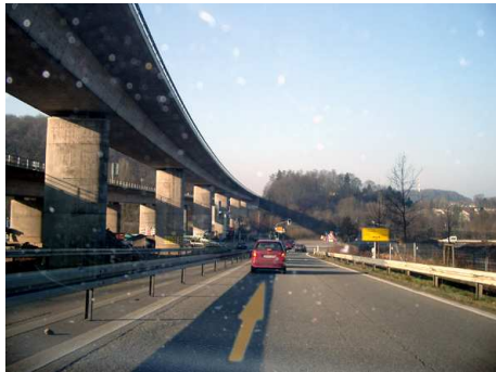
3. Autobahn abfahrt, unten nach links fahren