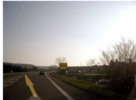
7. und kurz später wieder links