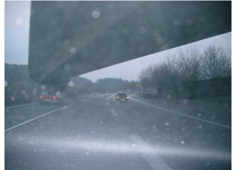
2. und aus St. Ingbert kommend