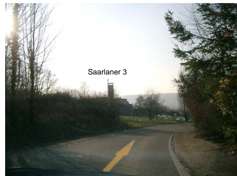
9. und schon seid ihr da.