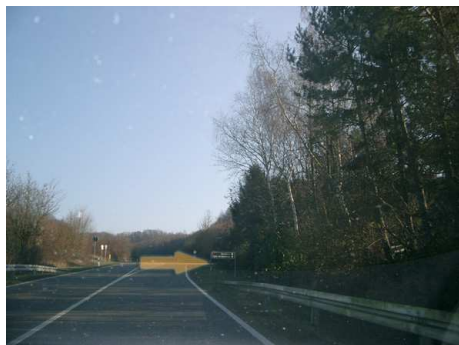
8. Hier gehts wieder in den Ort hinein