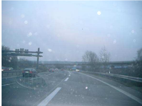
1. Ausfahrt aus Richtung Saarbrücken